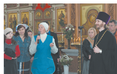
Беседовала Юлия АЛЕКСЕЕВА